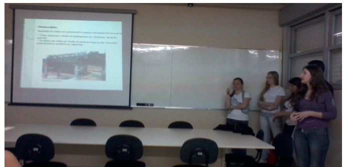
Apresentações do grupo da visita técnica (07 Nov 2011)

Não se esqueça de visitar o blog: < http://gtteb.blogspot.com/ >